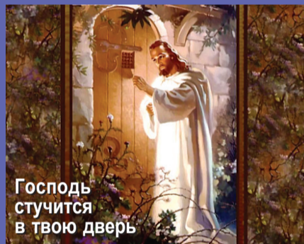
Господь стучится в твою дверь

Я – Господь, а вы не повинуетесь Мне; Я – ваш Бог, а вы не молитесь Мне; Я – Учитель, а вы не слушаете Меня; Я – ваш лучший Друг, а вы не любите Меня; Если вы несчастны, то не вините Меня